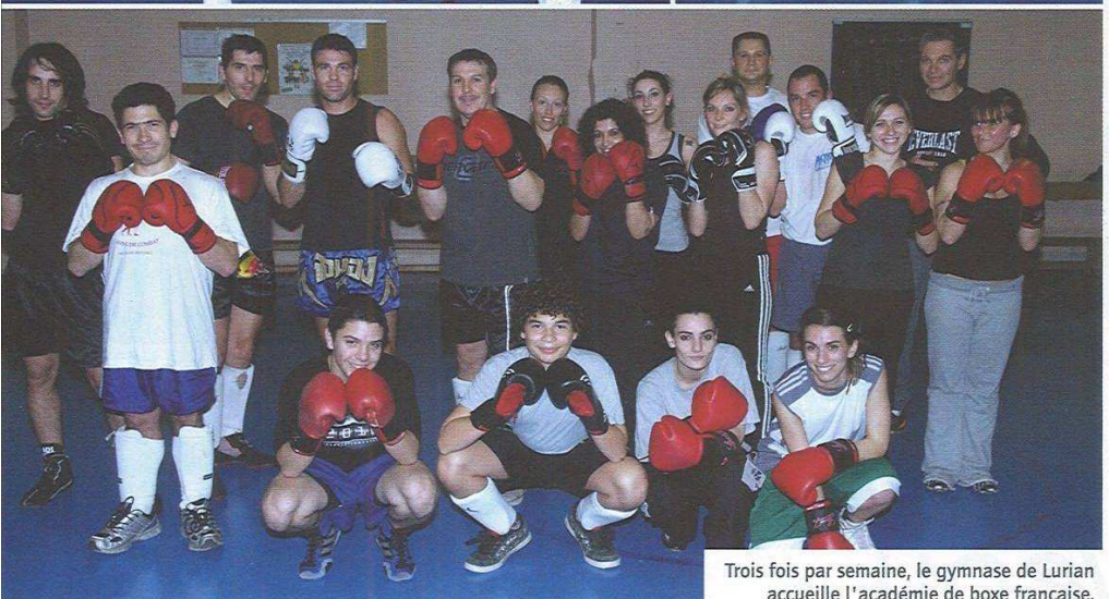
Trois fois par semaine, le gymnase de Lurian accueille l'académie de boxe française.